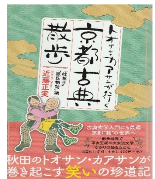
著書京都古典散歩

2022 年 12 月 「トオサン・カアサンが行く京都古典散歩～『枕草子』『源氏物語』編～」出版