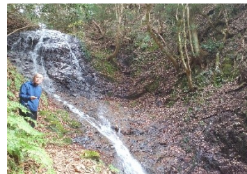
源氏物語に登場する音無の滝

1959 年 能代市住吉町生まれ 1982 年 3 月 秋田大学教育学部卒業 1983 年～2022 年 能代市内小中学校教諭 2002 年～2006 年 県教委指導主事 2006 年～2012 年 能代市内中学校教頭 2012 年～2014 年 八竜中学校校長 2014 年～2016 年 県総合教育センター主幹 2016 年～2019 年 淳城西小学校校長