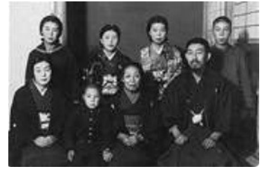
上 幼い頃に家族と(前列左から2人目) 下 平和を訴える活動

1934 (昭和9) 年 2 月 28 日 生まれ 1952 年 3 月 秋田県立能代南高等学校(現能代高等学校) 卒業 1953 年 3 月 国際キリスト教学園(国際キリスト教大学語学研究所) 卒業 1957 年 3 月 国際キリスト教大学教養学部卒業 1960 年 3 月 東京神学大学神学部卒業 1962 年 3 月 東京神学大学大学院修士課程修了 日本キリスト教団正教師(牧師)